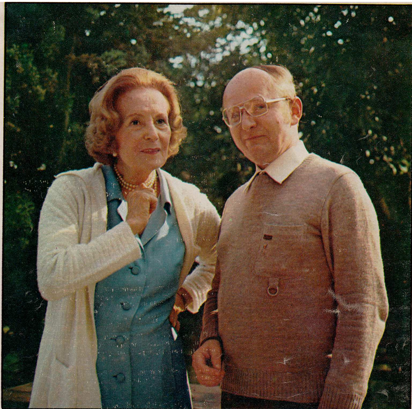
Jarmila Novotná a Ivan Jandl.