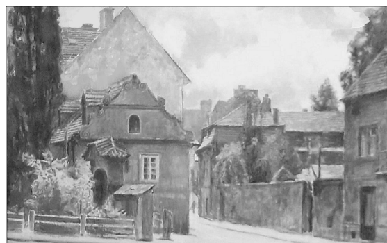
Neoznačený obraz v Muzeu hl. m. Prahy