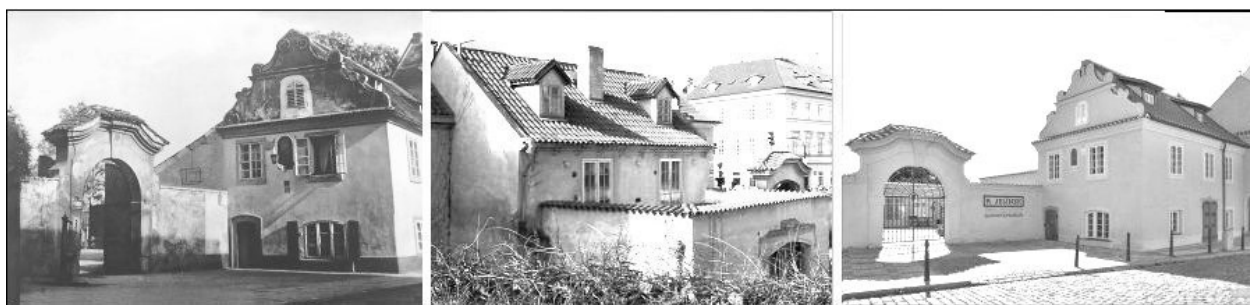
Dům U Bílé botky v ulici U Lužického semináře čp. 116. Zleva: starší nedatované foto, dále rok 2016 a 2019.

Ve filmu dostala Budínová první menší roli v Anně proletářce (1952). Významnější byla postava Rybové (na snímku) ve Fričově filmu Povodeň (1958). Skoro se nechce věřit, že to je ta krásná Valentýnka Nedobylová.