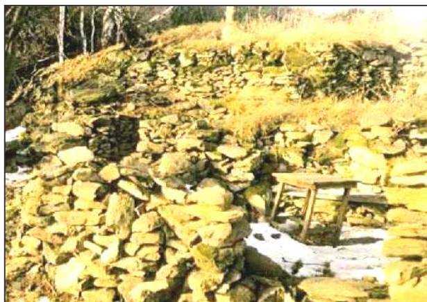
Tak skončil hezký příběh. Na detailech snímků vidíme, jak vypadá Hittei dnes. Dole jsou zbytky staveb, nahoře je vchod do původní svatyně. 12.2.1998