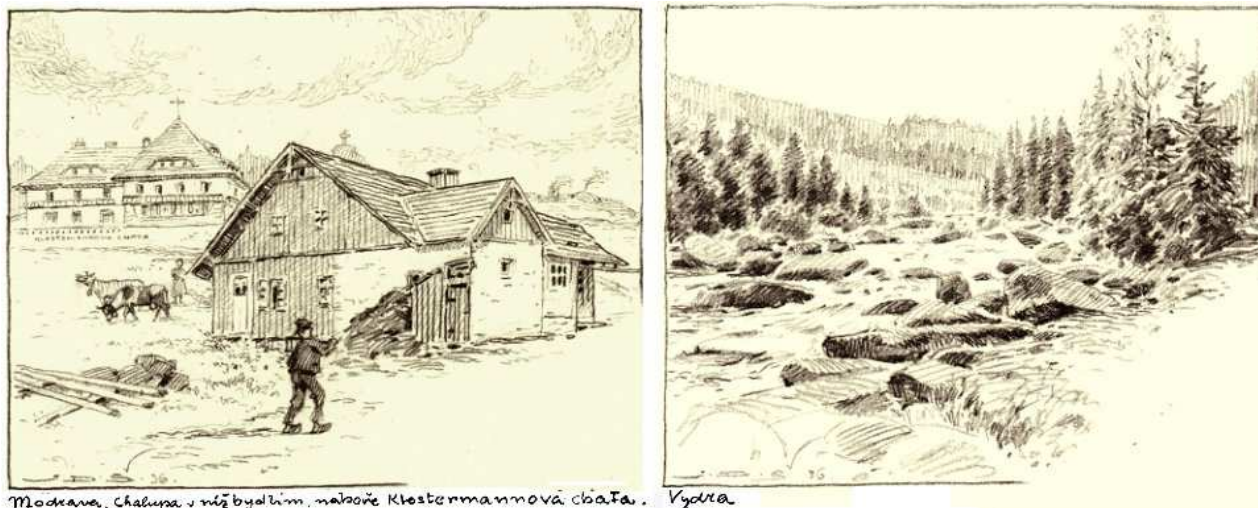
Modrava, chalupa v níž bydlím, nakreslil Khestermannová chata. Vyhlta

J. Dvořák Šumavský, kresby tužkou. Sign. JDŠ 36, orig. 18x24,7 cm, soukromá sbírka.