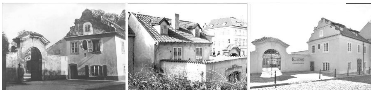
Dům U Bílé botky v ulici U Lužického semináře čp. 116. Zleva: starší nedatované foto, dále rok 2016 a 2019.

Ve filmu dostala Budínová první menší roli v Anně proletářce (1952). Významnější byla postava Rybové (na snímku) ve Fričově filmu Povodeň (1958). Skoro se nechce věřit, že to je ta krásná Valentýnka Nedobylová.