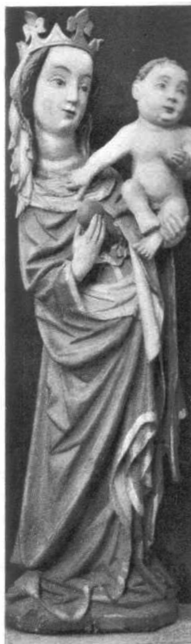
Obr. 110. Střížov. Soška Madonny. (Nyni v městském museu Budějovickém.)