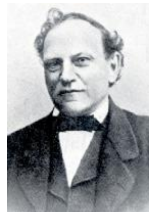
Karel Strakatý kolem roku 1850