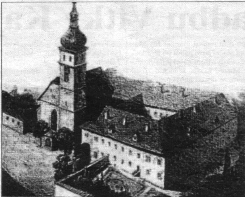
Conventus Ss. Apost. Petri et Pauli. Neocastri

Kostel a klášter servitů v Nových Hradech na mědirytině z 18. století