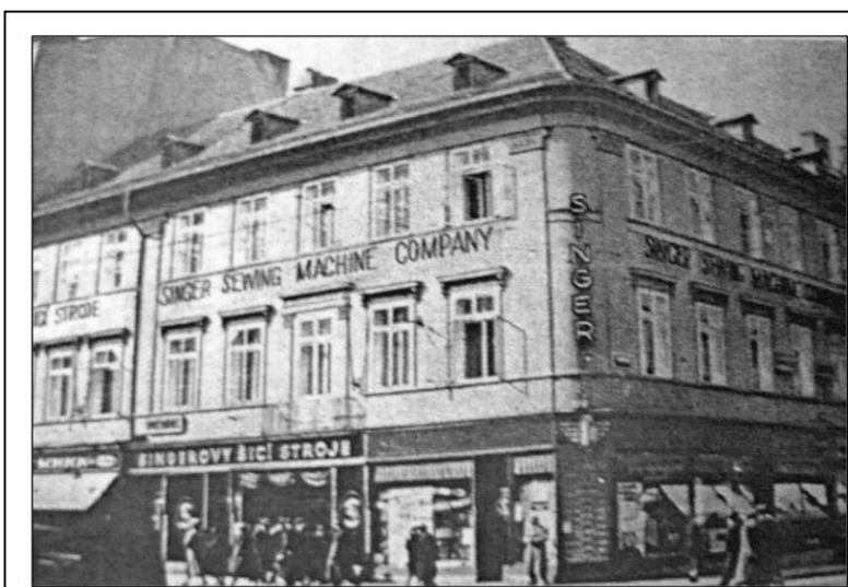
Reprezentační kanceláře a prodejna firmy Singer v Praze v ulici Na Příkopě

Když Evropa, tak také Rakousko - Uherská monarchie. A když Vídeň, tak také Praha. Zdejší hospodyňky už šicí stroj znaly díky Náprstkovi. Ten přivezl první „singrovku“ z Londýna a předvedl ji v Americkém klubu dam. Brzy na to Singer v Praze koupil dům a zařídil v něm svůj další obchod.