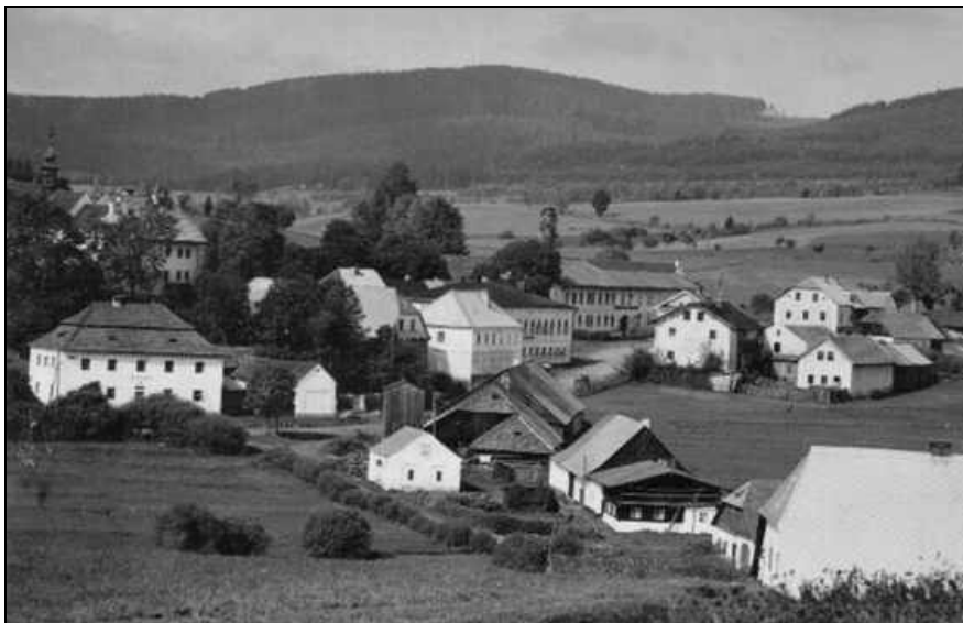
Horní Vltavice, zcela vlevo je v záběru budova školy čp. 40. Snímek je patrně z období 1. republiky.