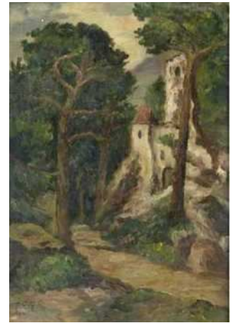
Vlevo obálka citované publikace, ze které je i snímek Fučíkova obrazu „Žně“, olejomalba 1923. Vpravo: Josef Fučík: „Zřícenina hrádku v lese“, 1. pol. 20. stol.