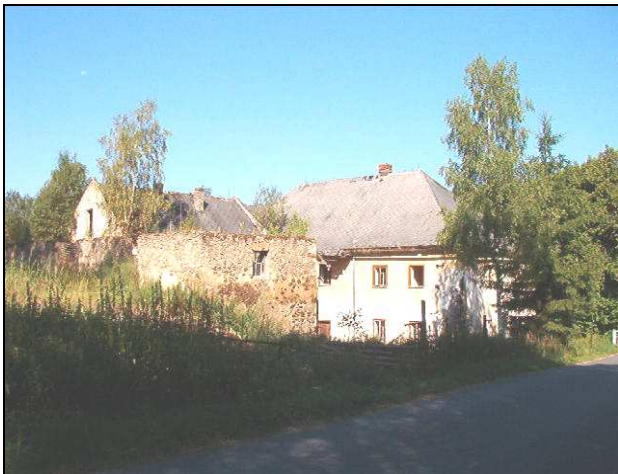
Blanický - Pauleho mlýn č. 25 patří k obci Blažejovice.