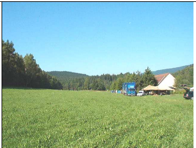
Od hranice lesa k domu č. 24 je to cca 100m.