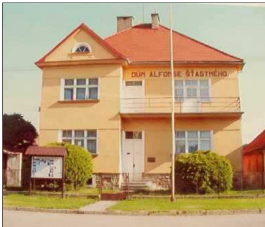
Padařov, okres Tábor. Dům Alfonse Šťastného postavený v letech 1934 – 1936. Foto 16. 8. 2013.